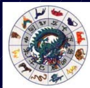
L'astrologie chinoise, avec ses signes animaux, fait appel à d'autres symboles, à une autre culture.