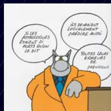
Philippe Geluck, « Le Char à Milhob », Casemérin, 1997

Les avancées dans la connaissance de l'Univers n'ont-elles rien à apporter à une discipline qui se prévaut scientifique et ancre dans la modernité ?