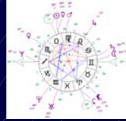
Un thème astral

– au cours de la vie, qui détermine les influences astrales du moment.