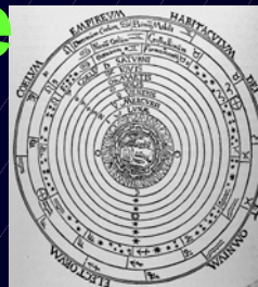
Le système de Ptolémée, géocentrique, sur lequel est fondée l'astrologie.